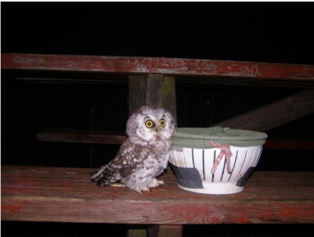
Första pärlugglan 2011.

Att jag åkte ut den där första kvällen i september 2011 var en ren tillfällighet. En kväll när jag inte hade något att göra och råkade titta ut genom fönstret konstaterade jag att flaggan på flaggstången utanför hängde slak. I mitt huvud fanns då den generella tanken att ugglor tycker om vindstilla och klara nätter och att det kanske kunde vara värt en tur ut till udden.