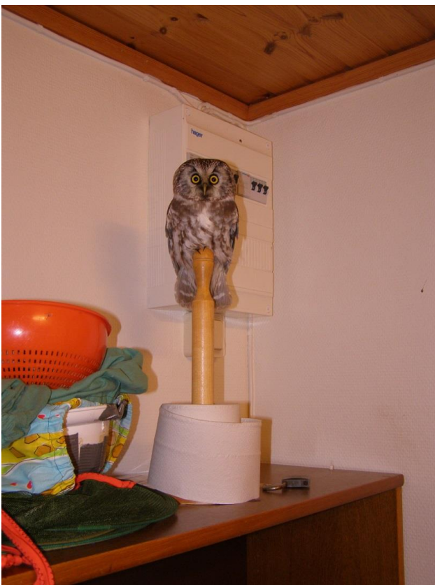
Pärluggla på besök i ringmärkarkuren.

Jag kommer i vilket fall i den mån jag har möjlighet att fortsätta leta troll till hösten och önskar alla som vill välkomna till Torhamns fågelstation när pärlugglorna börjar komma igång igen.