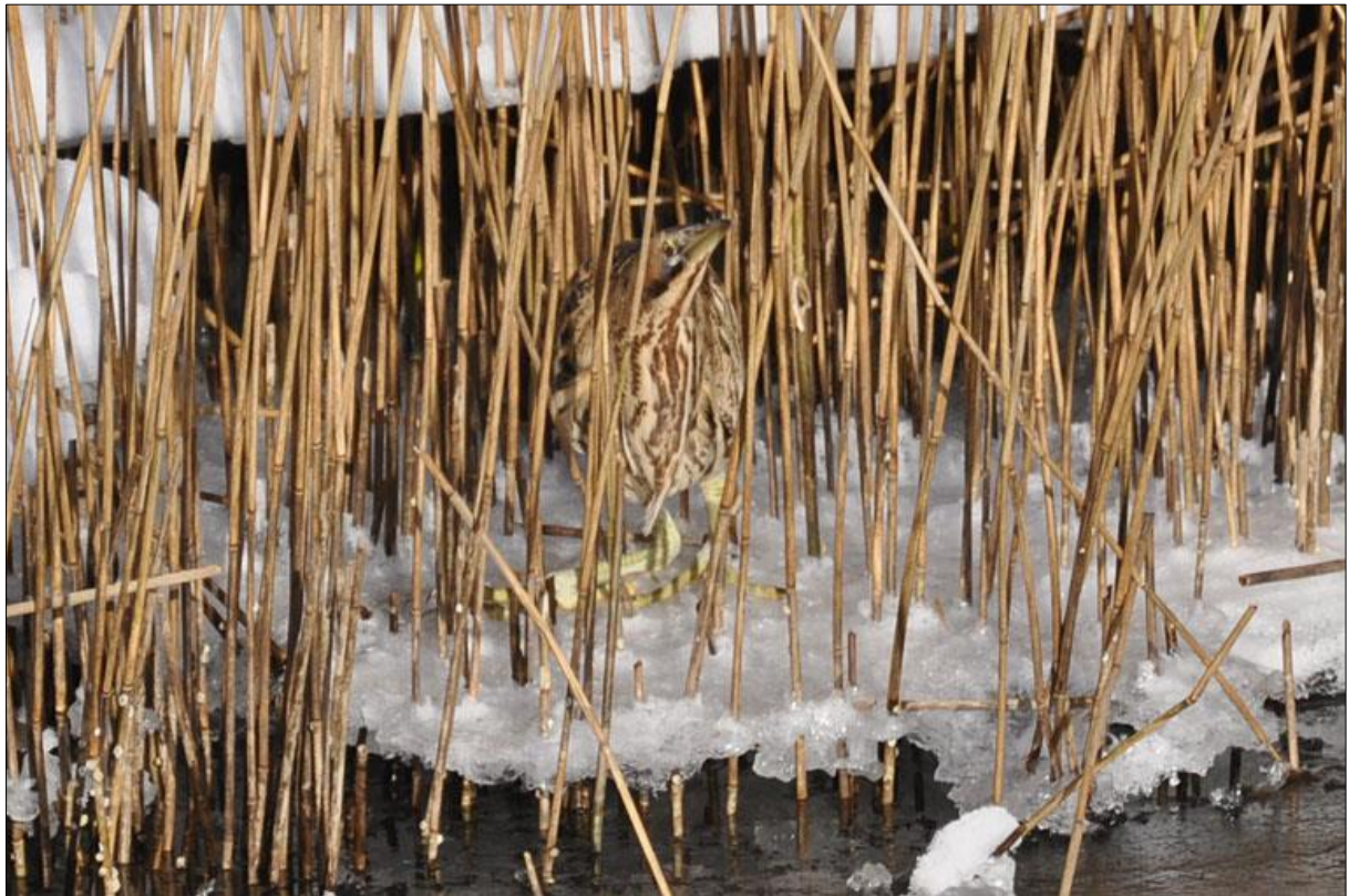
Rördrom vid bron, Munkahusviken, februari 2012.

Störst chans att få se rördrom i Blekinge har man under stränga isvintrar, då enstaka exemplar uppehåller sig vid ett fåtal platser där vattnet inte fryser till. Detta kan vara vid åmynningar eller smala sund där genomströmningen av vatten är god. Säkraste vintertillhåll under senare år har varit vassområdet norr om Gunnön (syd Mörrum) samt vid bron över sundet i Munkahusviken. Under dessa strängar vintrar dukar tyvärr många rördrommar under.