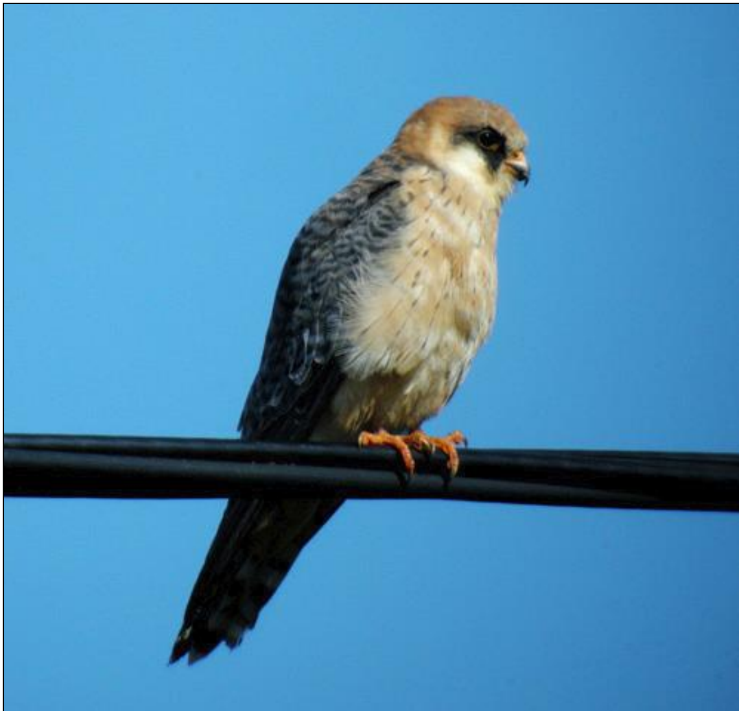
Aftonfalk. Torhamns udde i september 2010.

Två exemplar får anses som något under normal förekomst. Arten har varit årlig, förutom 2002 och 2009, sedan 1973.