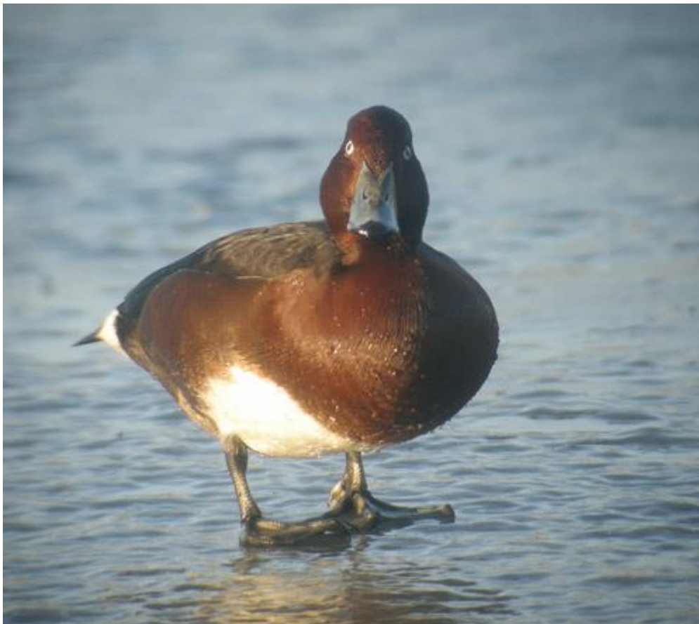
Vitögdd dykand. Munkahusviken jan-mars 2010.

Blekinges fjärde fynd och första för Karlshamns kommun! Den här långstannande individen utgör endast tredje vinterfyndet för Sverige! De båda tidigare har dock setts i början av december ( VF 29: 309 resp. VF 46: 444), så det här får anses som den första övervintrande vitögda dykanden i landet! Fågeln höll till i en vak som blev allt mindre, med finfina observationsmöjligheter som följde.