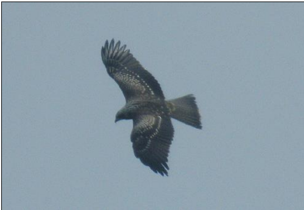
Brun glada. Angelskogs soptipp september 2010.

En årssumma på tio ex är den högsta noteringen någonsin i Blekinge! Det gamla rekordet var från 2007 och 2006 då sju fåglar observerades ( FBI 43: 44 resp. FBI 44: 53).