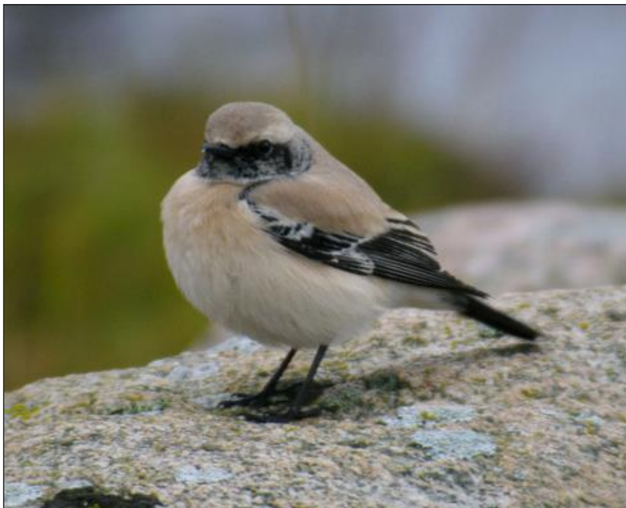
Ökenstenskvätta. Lindö udde i november 2010.

Andra fyndet för landskapet, det första gjordes på Utklippan, 1 hona 15.5 1983 (BOF 1993: Blekinges fåglar ). Ny art för lokalen nr 254.