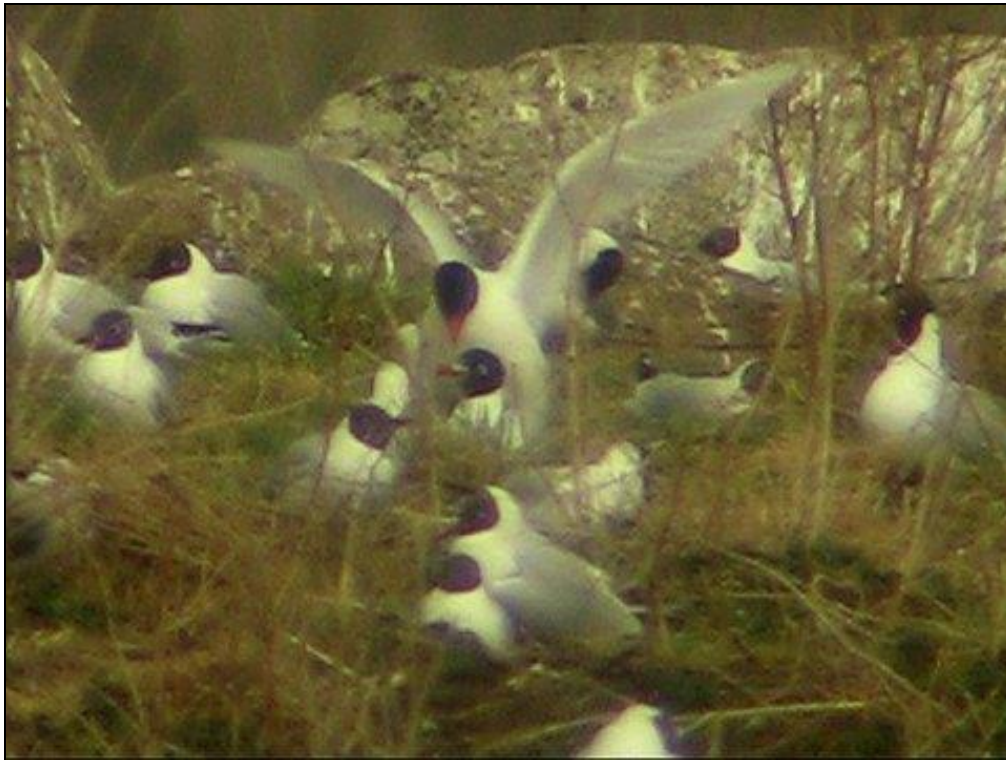
Svarthuvad mås. Parning på Falkaholmen i april 2010.

Överhuvudtaget utgör 2010 ett exceptionellt år för arten i Blekinge. Totalsumman om 16 ex, varav åtta utgörs av häckfåglarna, är en 50-procentig ökning av antalet individer sedda i Blekinge! De tre 1k-fåglarna som höll till kring Förkärla och Johannishus i augusti innebär ett nytt ansamlingsrekord, om man undantar häckarna. Tidigare har det som mest setts två fåglar vid ett par tillfällen, senast vid Fäholmen 2008 ( FBI 45: 69).