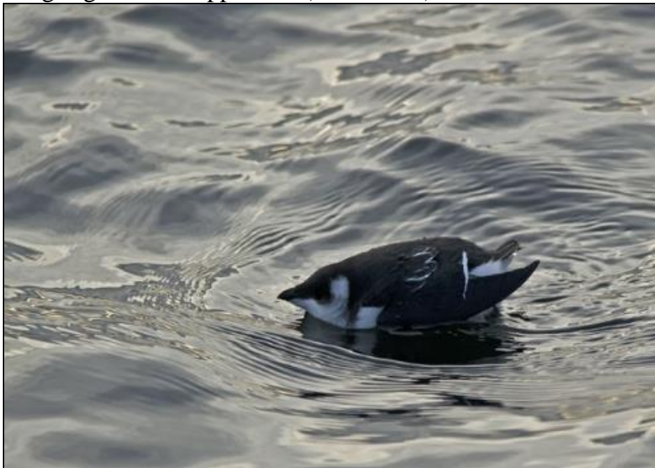
Alkekung vid Boön i januari 2010.

Som det nämndes i förra årsrapporten ( FBI 46: 67), bedöms Karlshamn-fågeln vara samma individ som huserat i området på diverse lokaler sedan 19.11 2010. Fågeln vid Maren utgör östra Blekinges första fynd sedan 2006, då en kung sågs vid Utklippan 9.5 ( FBI 43: 58).