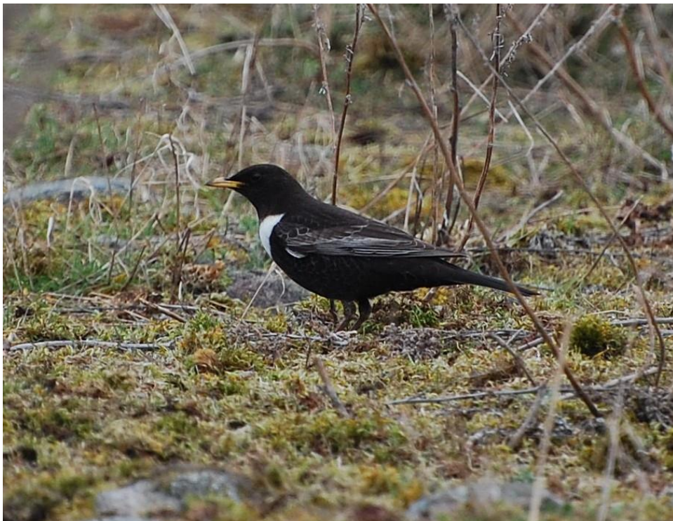
Ringtrast. Hanö i april 2010.

Våren bjöd på hela 38 ex, och sammanlagt sågs 41 fåglar under året. Det är den näst högsta summan någonsin, endast överträffad av 1997 då 48 ex noterades ( FBI 34: 91).