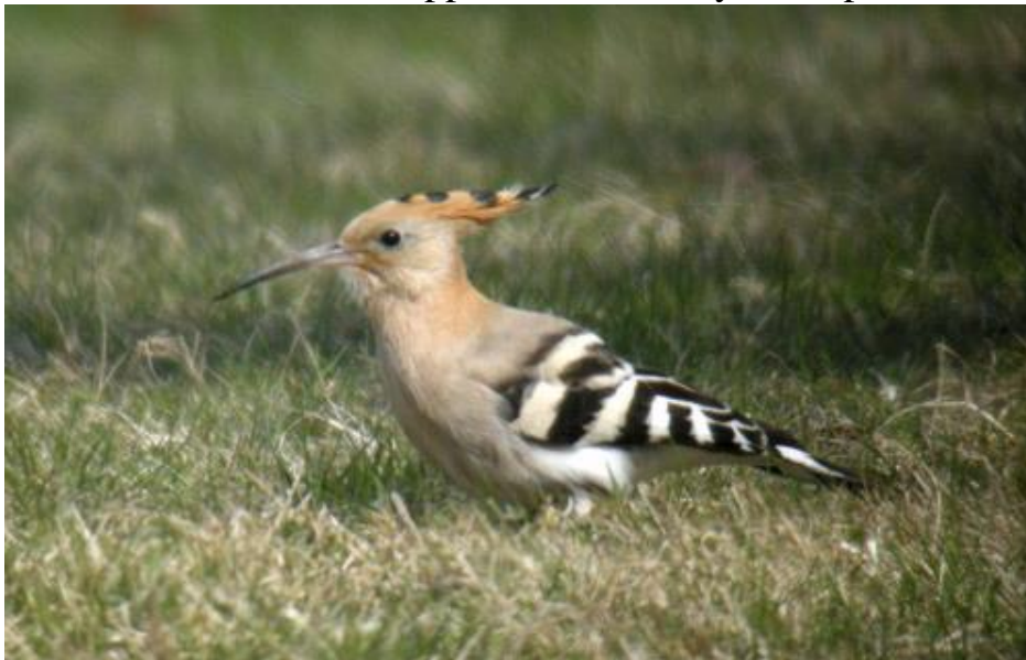
Härfågel. Almö i april 2010.

Inte helt utan tungsinne kan det konstateras att årets utbud av denna sydländska skönhet ter sig fullt normalt. Sedan de hyggliga åren -03 och -04, med nio ex vardera, har uppträdandet varit ytterst sporadiskt.