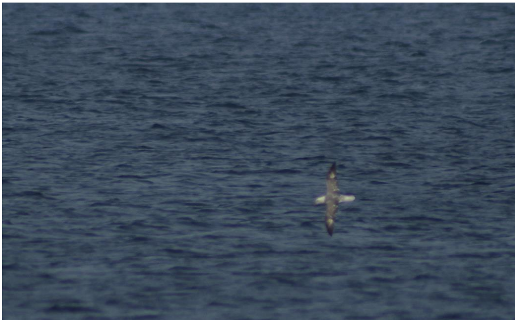
Stormfågeln vid Utklippan.

Ny art, nr 372, för Blekinges del! En sista ful lucka i landskapets gedigna artlista är därmed stängd! Följaktligen även ny art för Utklippan, nr 292. En artikel om fyndet finns för övrigt att läsa i nr 1/2001 av Fåglar i Blekinge (FBI 47: 30).