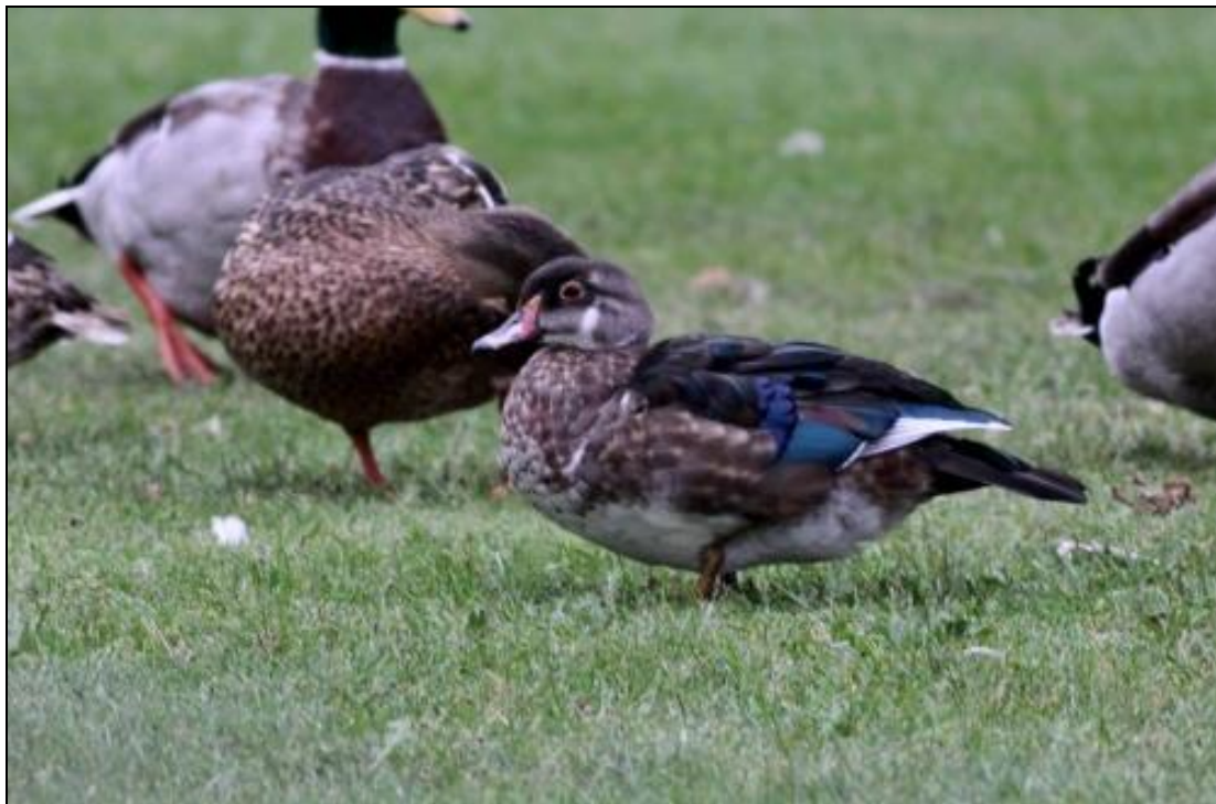
Brudanden i Norge.

Detta är fjärde gången som arten påträffas i Blekinge, senast var vid Tjurkö 17.5 1997 (FBI 34: 68). Ursprungligen härstammar brudanden från Nordamerika, men svenska fynd bedöms undantagslöst vara rymlingar från parker.