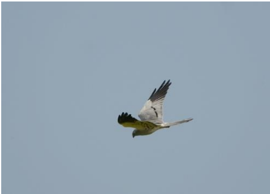
Ängshök. Hanen vid Mjällby i maj.

Den sistnämnda noteringen utgör nytt sträckrekord! Det tidigare rekordet var sex ex som har noterats vid flera tillfällen.