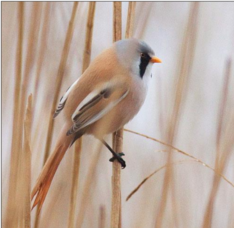
Skäggmes. Torstävaviken.

Obsar under lämplig tid på fyra vassrika lokaler. Dock ingen konstaterad häckning detta år.