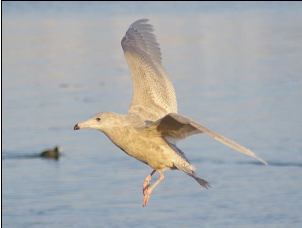
Vittrut. Saltö i december 2010.

En ytterst stationär och välbeskådad individ. Hur länge den blev kvar efter årsskiftet avslöjas i den kommande rapporten för 2011!