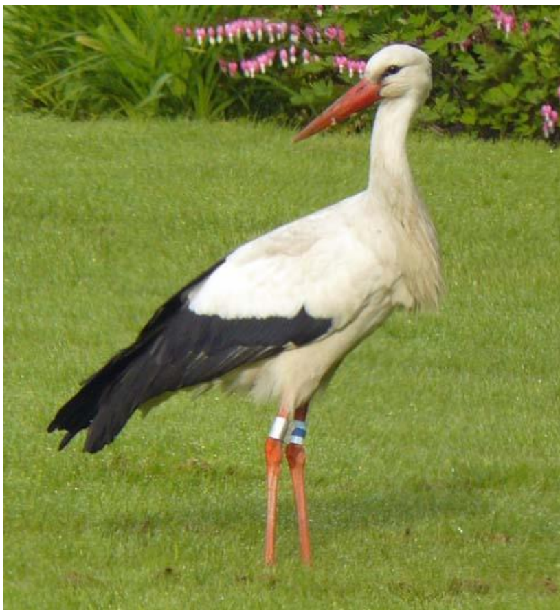
Vit stork. Bjäraryd maj 2010.

Alla märkta projektstorkar var olika individer. Totalt sex individer. Dock har ytterligare en fågel befunnit sig i landskapet. En sändarförsedd stork registrerades i området söder om Stiby på Listerlandet mellan kvällen 1.8 och tidiga morgonen dagen efter. För vidare information rekommenderas ett besök på storkprojektets hemsida!