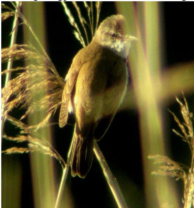
Trastångare. Ekenäs i juni 2010.

Tack vare denna fågel, som valde en liten vassrugge i kustbandet som tillfällig sångplats, är arten fortsatt årlig sedan 2002.